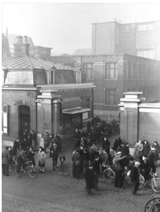
10. Tourcoing, sortie du personnel, Etablissements François Masurel Frères, vers 1950.