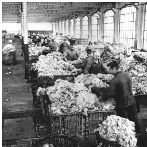
3. Roubaix, Peignage Amédée Prouvost, salle de triage de la laine brute, vers 1960.