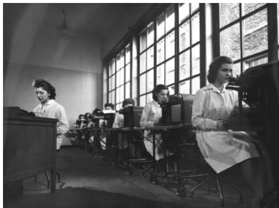
9. Tourcoing, la centrale de paie, Etablissements François Masurel Frères, quartier des Francs, vers 1950.

Nous consulter pour disposer des supports imprimables (diffusion-camt@culture.gouv.fr)