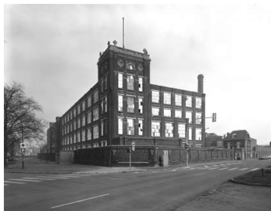
8. Tourcoing, peignage, filature, teinturerie et tissage Louis Lepoutre et Cie, 156 ch. Pierre-Curie © Inventaire Général, photographie Thierry Petitberghien, 2000.