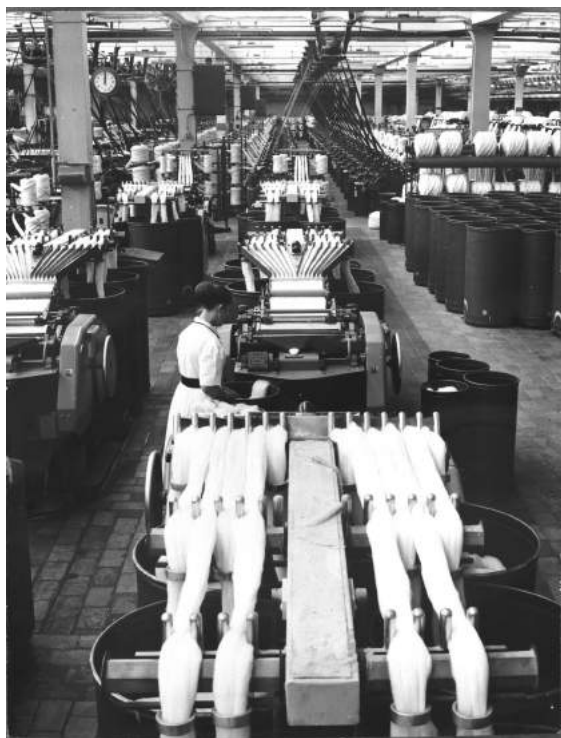
5. Roubaix, Peignage Amédée Prouvost, peigneuses rectilignes, vers 1950.

Nous consulter pour disposer des supports imprimables (diffusion-camt@culture.gouv.fr)