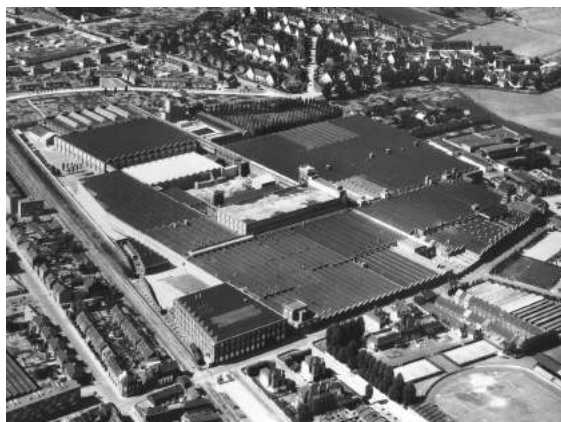
1. Roubaix, Groupe Prouvost SA, Lainière de Roubaix, vue générale des bâtiments, vers 1950.

Nous consulter pour disposer des supports imprimables (diffusion-camt@culture.gouv.fr)