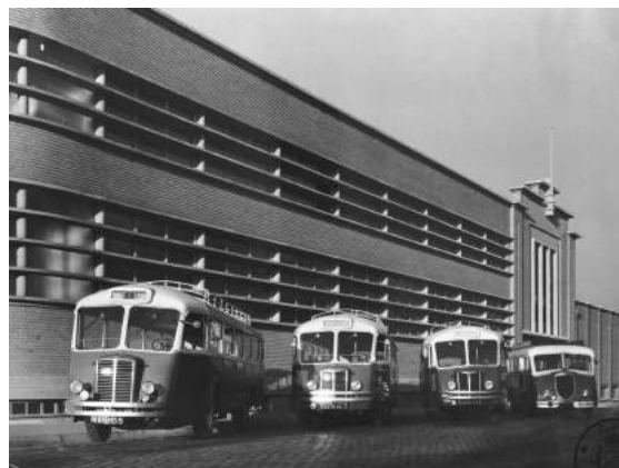
12. Tourcoing, Le transport du personnel, Etablissements François Masurel Frères, quartier des Francs, vers 1950.