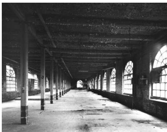
6. Roubaix, Peignage Alfred Motte et Cie, rue d'Avelghem. © Inventaire Général, photographie Thierry Petitberghien, 1994.