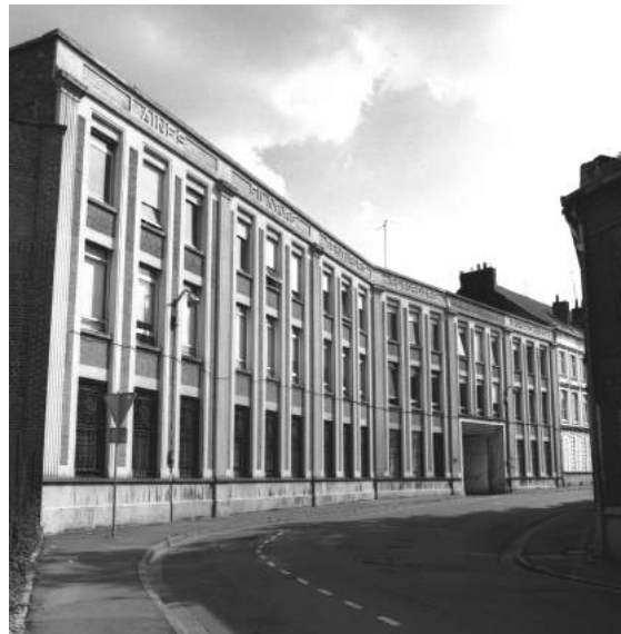
7. Tourcoing, Filature Charles Six, 66, rue du Château.