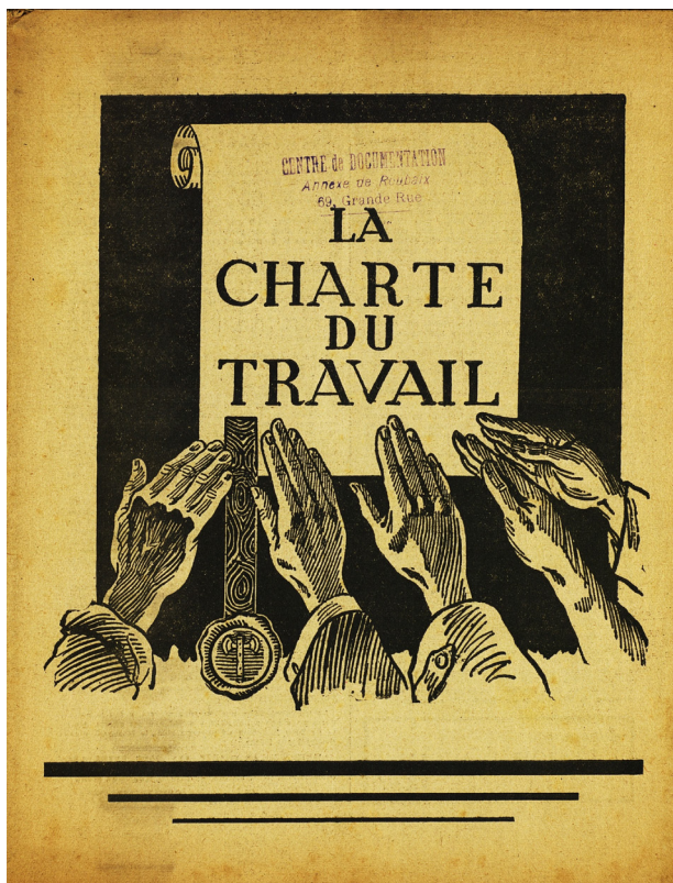
Brochure « La charte du travail », page de couverture, sans date, ANMT 2002 26 23, pièces isolées sur support papier

Les documents d'époque et témoignages présentés dans l'exposition mettent en lumière et en contexte cette expérience individuelle et collective des générations ayant vécu et travaillé en temps de guerre, alors qu'elles disparaissent peu à peu, et qu'aujourd'hui même, en divers lieux du globe, des hommes et des femmes travaillent en temps de guerre.