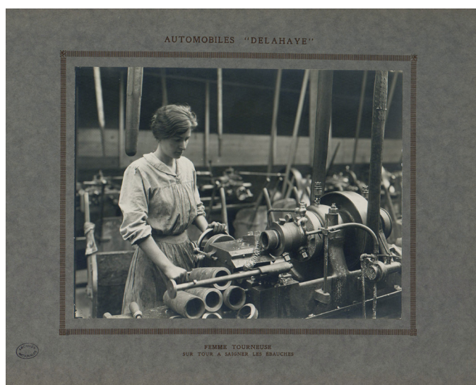
Photographie issue de l'album « Usines Delahaye, Collaboration des femmes à la Défense nationale » : photographie, vers 1917, ANMT 2014 39 2, pièces isolées iconographiques

L'exposition met en valeur de nombreux documents d'archives issus des fonds collectés et conservés par les ANMT (compagnies minières ou de chemins de fer, industries d'armement, établissements bancaires, syndicats patronaux ou ouvriers...) mais aussi des collections d'autres services d'archives et institutions patrimoniales du territoire national, par exemple les Archives nationales d'outre-mer (ANOM) qui ont prêté des documents sur les travailleurs indochinois, ou les archives municipales d'Evron et de la Communauté de communes des Coëvrons (Mayenne) qui ont collecté les archives personnelles et témoignages de requis au STO.